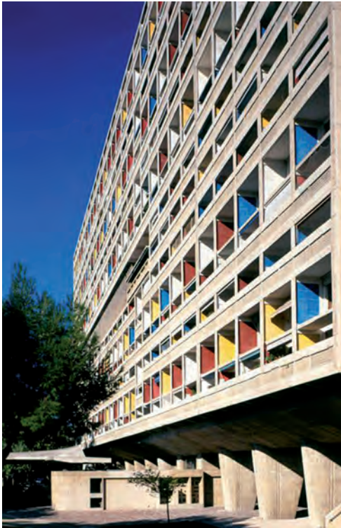
Figura 3 – Le Corbusier, Unidade Habitacional de Marselha , França, 1947-1952