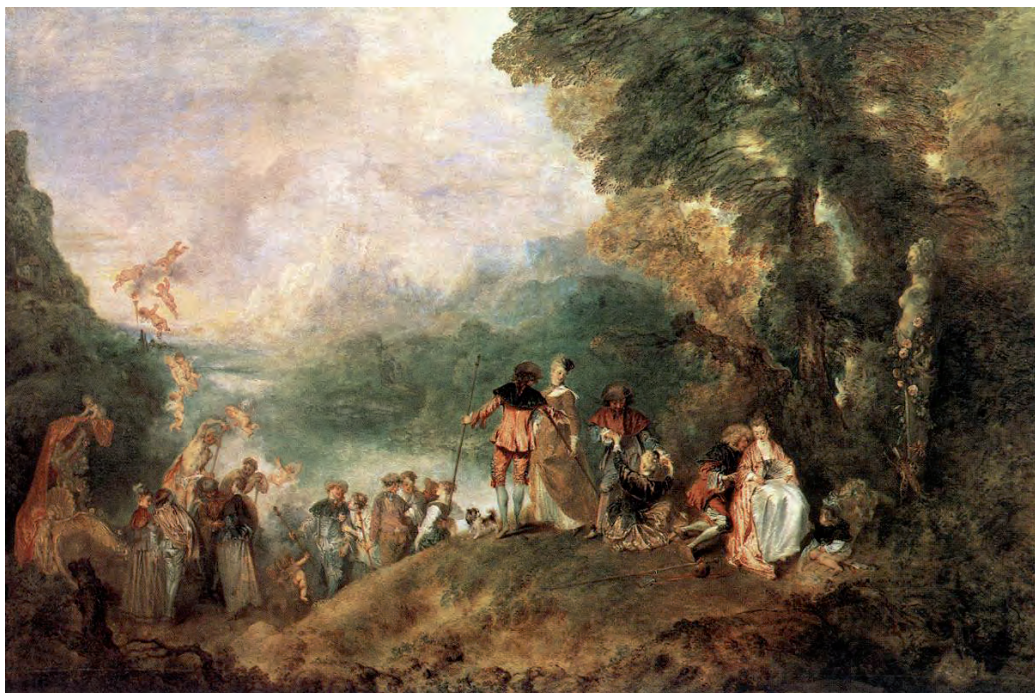
Figura 5 – Antoine Watteau, Peregrinação à Ilha de Cítera , 1717, óleo sobre tela, 129 x 194 cm

in www.wikipedia.org (consultado em outubro de 2019).