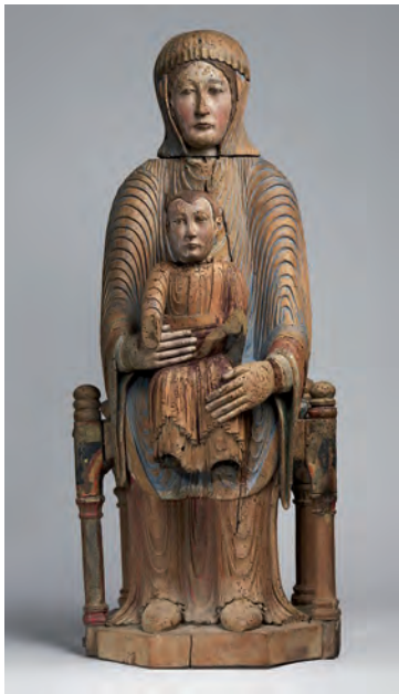
Anónimo, Virgem e Menino em majestade , c. 1175-1200, in www.metmuseum.org .