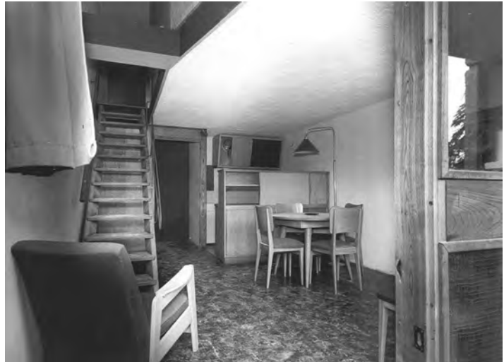
Figura 4 – Le Corbusier, interior de um apartamento da Unidade Habitacional de Marselha , França, 1947-1952

2.1. Explícite duas características da arquitetura de Le Corbusier presentes na construção da Unidade Habitacional de Marselha , recorrendo ao Texto B e às Figuras 3 e 4.