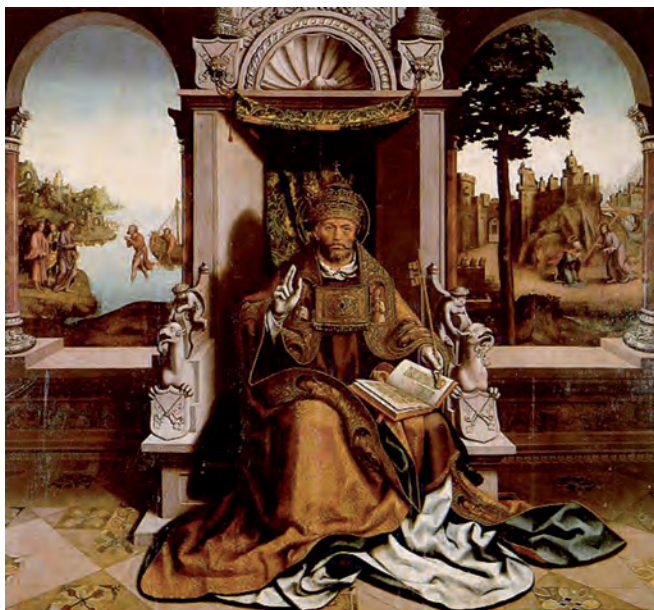
Figura 2 – Grão Vasco, São Pedro , 1506, óleo sobre madeira, 213 x 213,3 cm