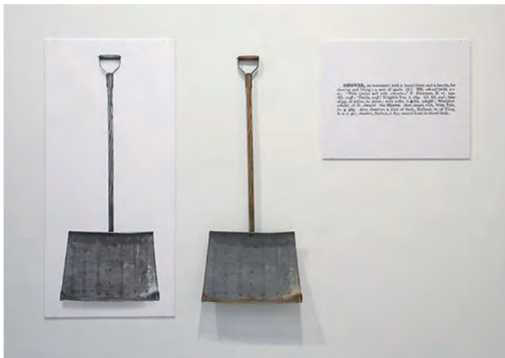
Figura 6 – Joseph Kosuth, Uma e três pás , 1965, fotografia, madeira e metal, e painel com texto apresentando a definição da palavra «pá»

O que é a arte? Como se deverá definir o seu contexto? Poderá a arte ser criada e compreendida quando já não está ligada a um objeto estético? [...] Poderá o discurso sobre a própria arte ser arte?