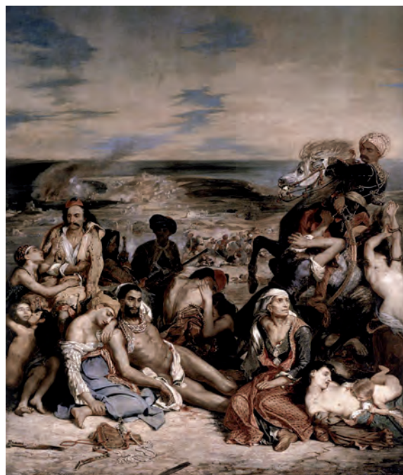
Figura 2 – Eugène Delacroix, O Massacre de Quios (episódio da luta pela independência da Grécia face ao Império Turco), 1824, óleo sobre tela, 419 x 354 cm

Analise a diversidade da pintura romântica, recorrendo ao Texto A e às Figuras 1 e 2 e abordando os temas seguintes: