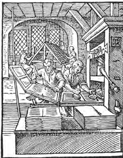
Figura 1 – Jost Amman, Oficina tipográfica , xilogravura, 1568

Lucien Febvre, O Problema da Descrença no século XVI , Lisboa, Editorial Início, 1970, pp. 429-430. (Texto adaptado)