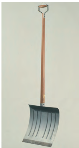
Figura 5 – Marcel Duchamp, Prelúdio a um braço partido , madeira e metal, 1964, versão do original de 1915