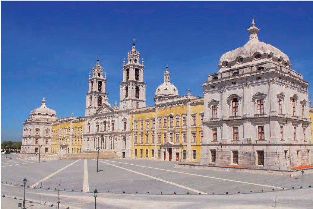
Figura 4 – João Frederico Ludovice, Real Edifício de Mafra , 1717-1730-1737

in www.cm-mafra.pt (consultado em outubro de 2019).