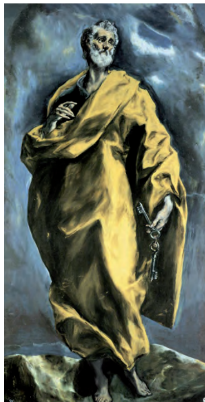
Figura 3 – El Greco, São Pedro , 1610-1613, óleo sobre tela, 209 x 106 cm

Compare as pinturas reproduzidas nas Figuras 2 e 3.