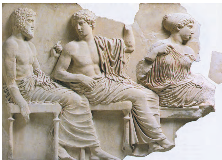
Figura 1 – Deuses assistindo à procissão das Panateneias, friso do Pártenon , oficina de Fídias, 442-438 a. C., Museu da Acrópole, Atenas