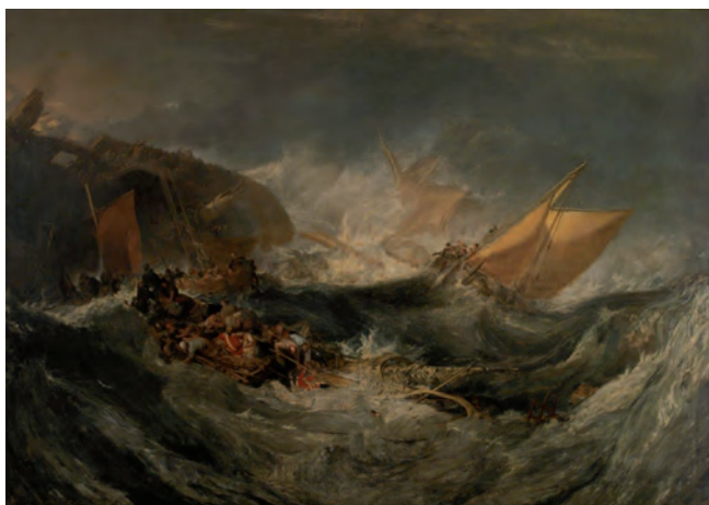
Figura 1 – William Turner, Naufrágio de um cargueiro , 1810, óleo sobre tela, 173 x 245 cm

Isabel Coll, «O Romantismo», in Tesouros Artísticos do Mundo , dir. Bernardo Pinto de Almeida, Amadora, Ediclube, Vol. VIII, 1995, p. 195. (Texto adaptado)