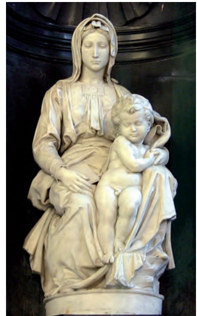
Miguel Ângelo, Madona de Bruges , 1501-1504, in https://en.wikipedia.org .