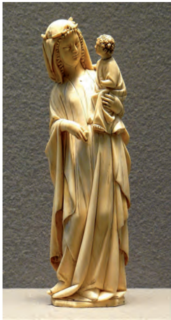
Anónimo, Virgem e Menino , século XIII, in https://en.wikipedia.org .